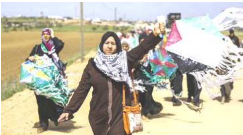
SOUTIEN À LA MARCHÉ DU RETOUR STOP AUX CRIMES ISRAËLIENS

Les bénéfices de la soirée seront reversés à des ONG palestiniennes qui agissent sur le terrain.