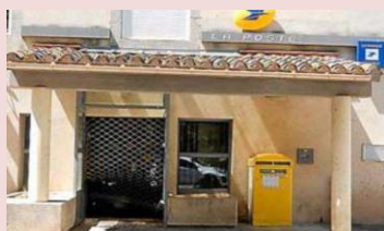
La Poste de Villegailhenc

Les services publics, notre bien commun, méritent mieux que le traitement qui leur est infligé. Les communistes soutiennent les actions de la CGT et seront partie prenante de toutes les mobilisations des salariés et des usagers. Loin des politiques d'austérité mise en œuvre depuis des décennies, le PCF propose au contraire de relancer les services publics en particuliers dans les territoires suburbains et ruraux.