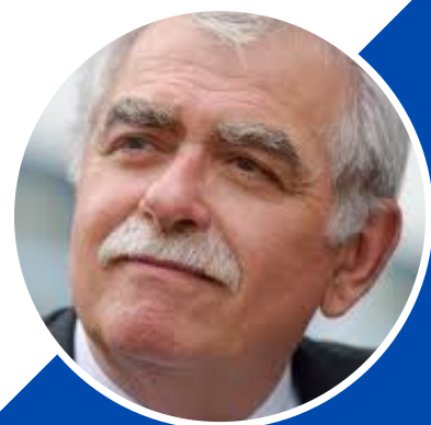
André CHASSAIGNE Président du groupe des Député-es Communistes

Salle L'Oc-halle, 1 Bd Georges Séguy (face médiathèque). À midi, nous clôturerons ces échanges par un apéritif cubain.